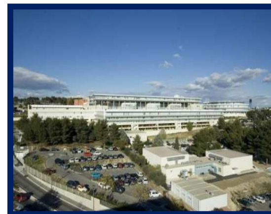
PACES Nîmes Chemin du Carreau de Lanes

Des enseignements communs et un concours unique.