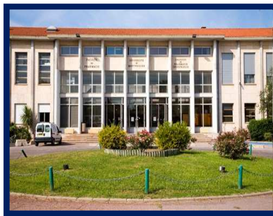
PACES Flahault av. Charles Flahault